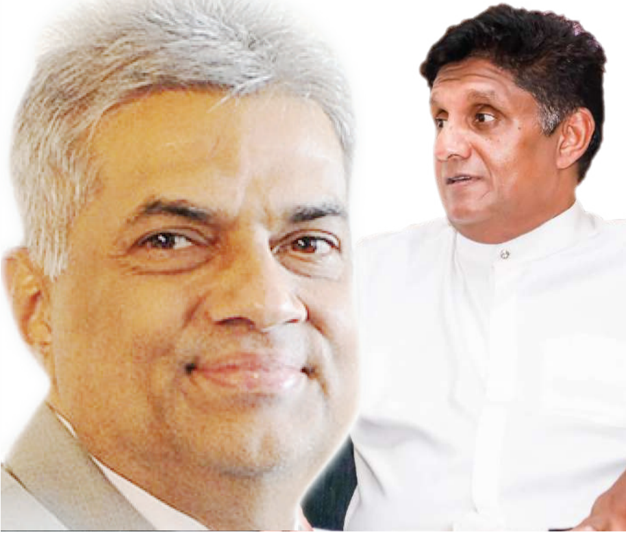
ரணில் விக்ரமசிங்க மற்றும் சஜித் பிரேமதாச

ஆகியோர் ஒன்றிணைந்து செயற்பட வேண்டும் என்று ஐக்கிய தேசிய கட்சியின் ருவான் விஜயவர்தன கூறியுள்ளார்.