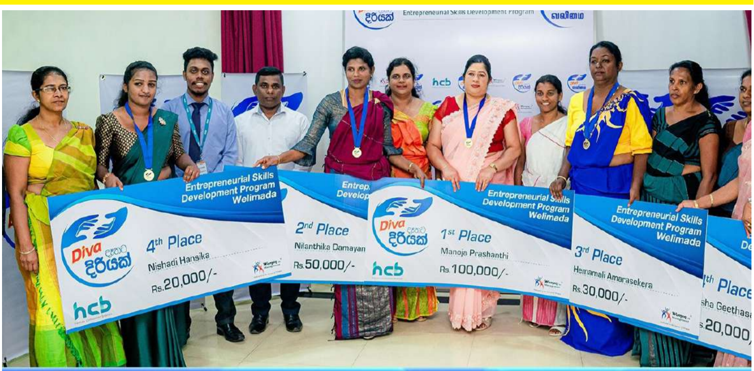
Women in Management (WIM) அமைப்புடன் இணைந்து உடனடியான உழைப்பை நிறுவுவதற்கான உழைப்பை நிறுவுவதற்கான