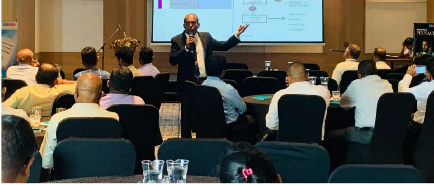
ஸ்ரீ லங்கா இன்ஸூரன்ஸ் கோர்பரேஷன் ஜெனரல் லிமிடெட் (SLICGL) நிறுவனத்தினால் புரண