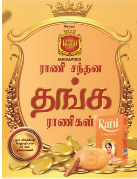
கரட் கொண்டு 18 தங்க நாணயங்களை, ஆறு வார காலப்பகுதியில் வெல்லும்

சுதேசி நிறுவனமானது, அதன் விசுவாசமான ராணி சந்தன சவர்க்காரத்தை பயன்படுத்தும் விசுவாசமான வாடிக்கையாளர்களுக்கு, 6 வாரங்களுக்கு வாராந்தம் தலா 3 தங்க நாணயங்கள் வீதம் 22 கரட்டில் அமைந்த தங்கத்தை வழங்குகிறது. WhatsApp (077 0089716) உடனாக அல்லது Rani Sandalwood பேஸ்புக் பக்கத்தின் ஐடிஎம்ஐ இற்கு ராணி சந்தன சவர்க்காரத்தின் இரண்டு வெற்று பெட்டிகளுடன் வாடிக்கையாளரின் பெயர், தேசிய அடையாள அட்டை இலக்கம், தொலைபேசி இலக்கத்தை அனுப்புவதன் மூலம் அல்லது "ராணி சந்தன தங்க ராணிகள்", தபால் பெட்டி இல 04, கந்தாணை எனும் முகவரிக்கு அனுப்புவதன் மூலம், ரூ. 3 மில்லியன் பெறுமதியான 22