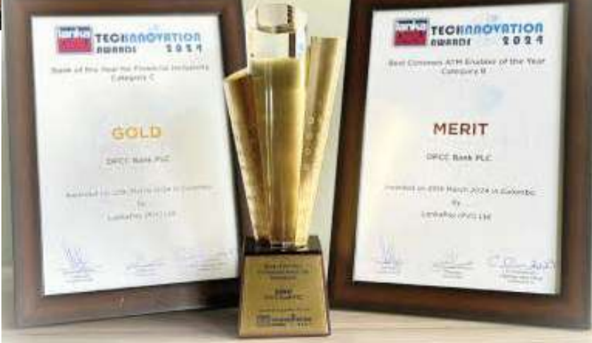
செதுக்கி, 'அனைவருக்கும் ஏற்ற வங்கி' ஆகத் திகழ்வதில் DFCC வங்கியின்

கிடைக்கப்பெற்ற அங்கீகாரம் எமக்கு மிகுந்த கௌரவம் அளிக்கின்றது. மிகவும் மதிப்பிற்குரிய இந்த மேடையில் எமக்கு கிடைக்கப்பெற்ற முதலாவது தங்க விருதாக இது அமைந்துள்ளதுடன், DFCC வங்கியை அனைவருக்கும் ஏற்ற ஒரு முதன்மையான நிதியியல் நிறுவனமாக நிலைநிறுத்துவதற்காக உழைக்கின்ற பல்வேறு நபர்கள் மற்றும் அணிகளின் ஓயாத அர்ப்பணிப்பிற்கு சான்று பகருகின்றது என்று குறிப்பிட்டார்.