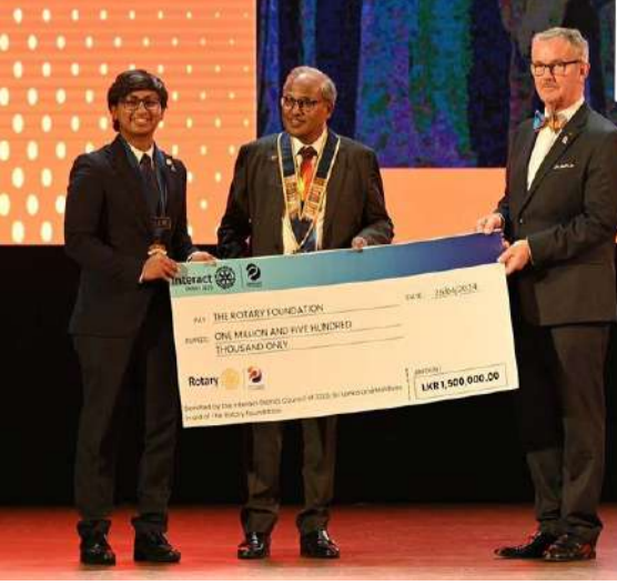
மற்றும் நல்லெண்ணத்தை மேம்படுத்துவதில் அதன் பங்கிற்காக

அத்தோடு உலகில் உள்ள அமைப்பு நாடுகளிடையே அமைதி