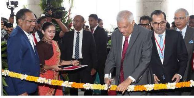
ITC Limited நிறுவனத்தின் முழுமையான துணை நிறுவனமான WelcomHotels Lanka (Private) Limited நிறுவனத்தினால்

திறந்துவைக்கப்பட்டுள்ள ITC ரத்னதீப ஆடம்பர ஹோட்டல் தொகுதி இலங்கையின் சுற்றுலா மற்றும் விருந்தோம்பல் துறையை வளப்படுத்துவது என்ற உறுதிப்பாட்டுடன் கொழும்பில் விண்ணைத் தழுவும் மாணிக்கப் படிக்கமாக மிளிர்கின்றது.