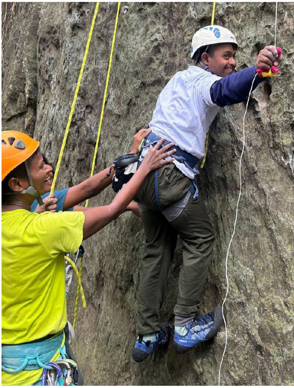
குன்று ஏறல் நிகழ்வை முன்னெடுக்க

யாத்திரிகர்கள் மற்றும் பார்வையாளர்கள் மக்கா மற்றும் மதீனா நகரங்களிற்கு ஈர்த்து அவர்களுக்கு சிறந்த பயண அனுபவத்தை வழங்குவதையும் நோக்கமாகக் கொண்டுள்ளது. பயண முகமையாளர்கள், புனித ஹஜ் உம்ரா யாத்திரை மற்றும் சுற்றுலா