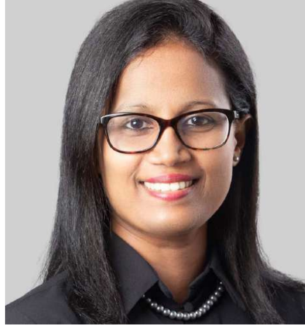
தேவைகள் மற்றும் விருப்பங்களை உள்ளடக்கிய வகையில் எங்கள்

இந்த ஆண்டு, மளிகை சாமான்கள் மற்றும் தினசரி அத்தியாவசிய பொருட்கள் முதல் உயர்தர எலக்ட்ரோனிக்ஸ் மற்றும் ஆடம்பரமான உணவு அனுபவங்கள் வரை பலவிதமான