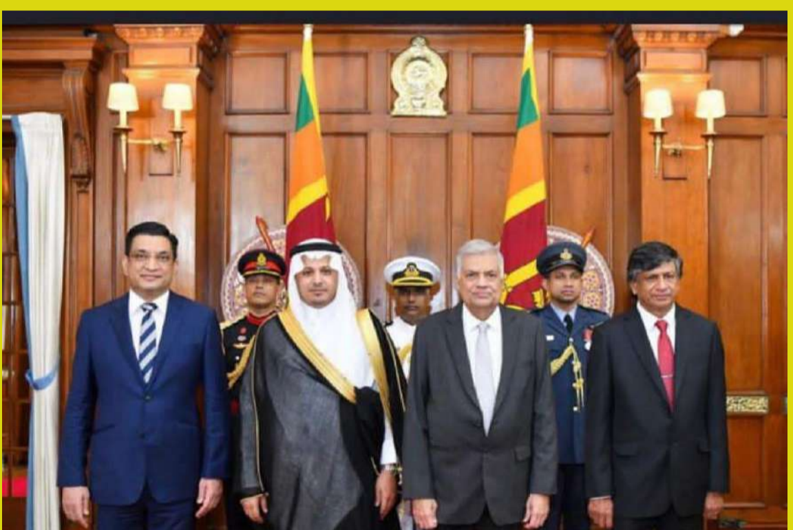
இலங்கை ஜனநாயக சோசலிச குடியரசின் 76 வது சுதந்திர தினத்தை முன்னிட்டு, இலங்கை ஜனநாயக சோசலிச குடியரசின் மாண்புமிகு ஜனாதிபதி ரணில் விக்கிரமசிங்க அவர்களுக்கும், கௌரவ பிரதமர் தினேஷ் குணவர்தன அவர்களுக்கும், இலங்கை அரசு மற்றும் அதன் நேசமிகு குடிமக்களுக்கும் எனது மனமார்ந்த நல்வாழ்த்துக்களைத் தெரிவித்துக் கொள்வதோடு, இலங்கைக் குடியரசு மேலும் முன்னேற்றமும் செழிப்பும் பெற வேண்டும் என வாழ்த்துகிறேன்.

உண்மையில் இஇந்தப் பிரச்சினைகள் எல்லாம் எப்போது தீர்க்கப்படுகிறதோ அப்போதுதான் மக்கள் உண்மையான சுதந்திரத்தை உணர்வார்கள். அதுவரைக்கும் இந்த நாடு சுதந்திரம் அடைந்தும் சுதந்திரம் அல்லாத நாடாகவே மக்களால் பார்க்கப்படும்.