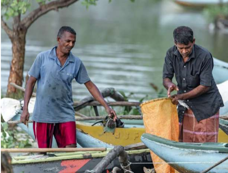
(எம். ஜி. எம். அஸ்ஹர் )

அன்றாடம் தொழில் செய்து தமது ஜீவனோபாயத்தை கடத்தும் மற்றுமொரு கூட்டம் தான் மீனவ சமூகம். அன்றைய தினம் தமக்கு சரியாக மீன் படவிலையைன்றால் அந்த குடும்பத்தின் நிலை அவ்வளவுதான். கடலையும் களப்பையும் ஆற்றையும் நம்பி இவர்கள் வாழ்வு சமுன்று கொண்டிருக்கின்றது.