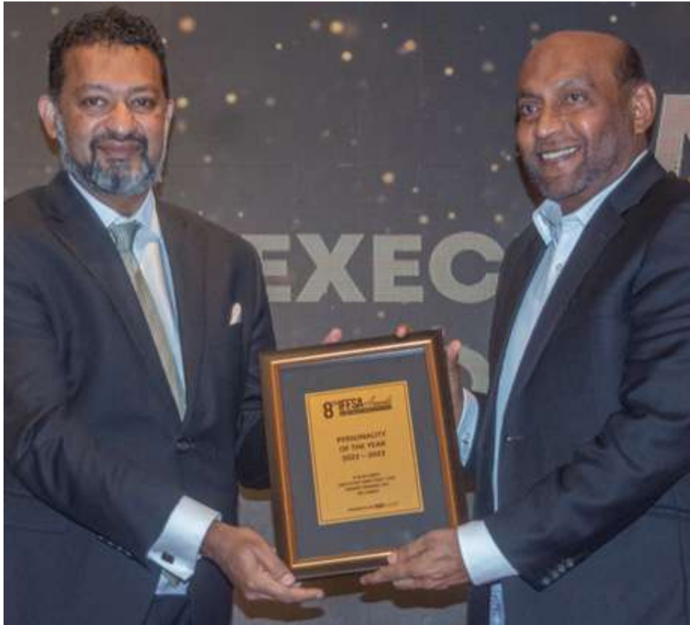
ஓரியன்ட் பைனான்ஸின் மாற்று நிதி வணிகப் பிரிவு (AFBU) சமீபத்தில் "தெற்காசியாவின் வளர்ந்து வரும் இஸ்லாமிய நிதி நிறுவனம்" என்ற சர்வதேச அங்கீகாரத்தைப் பெற்றதன் மூலம் அதன் பயணத்தில் ஒரு முக்கியமான மைல்கல்லை