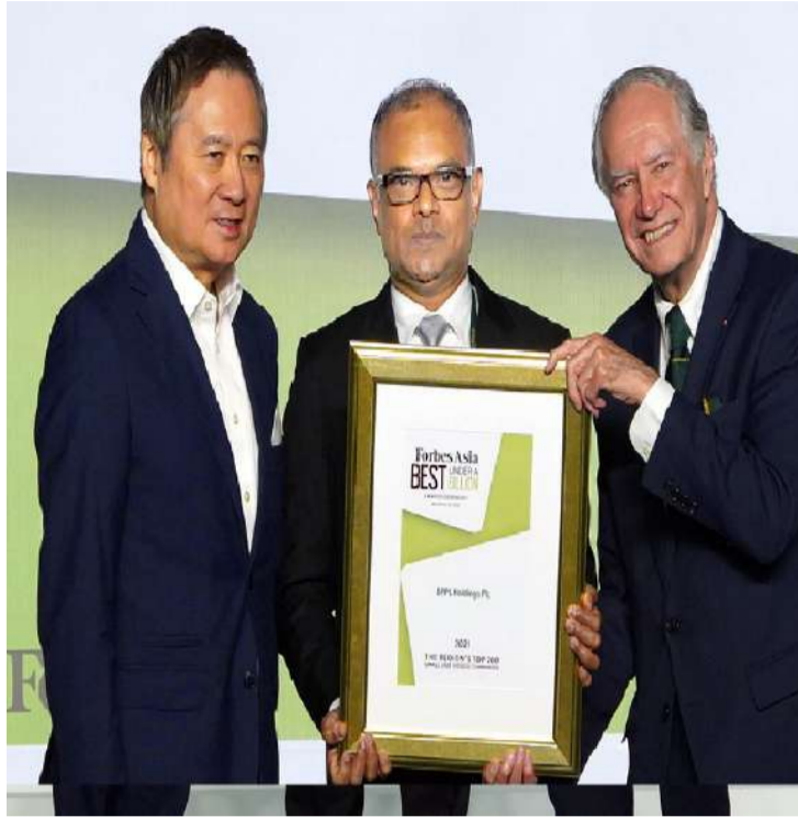
ஒரு கடுமையான தேர்வு செயல்பாட்டில், ஆசிய-பசிபிக் பிராந்தியத்தில் 20,000க்கும் மேற்பட்ட பொது வர்த்தக நிறுவனங்களின் வருடாந்திர விற்பனை 10 மில்லியன் அமெரிக்க டாலருக்கும் அதிகமாகவும் ஆனால் 1 பில்லியன் டாலருக்கும் குறைவாகவும், இந்த மதிப்புமிக்க விருதுக்கு தேர்ந்தெடுக்கப்பட்ட 200 சிறந்த நிறுவனங்களில் BPPL Holdings

BPPL Holdings PLC, தூரிகை மற்றும் ஃபிலிமென்ட் ஏற்பாடு உற்பத்தித் துறையில் முன்னணியில் இருக்கும், Forbes Asia ஆல் 2021 ஆம் ஆண்டிற்கான ஆசியாவின் "Best Under a Billion" விருது வழங்கப்பட்டது.