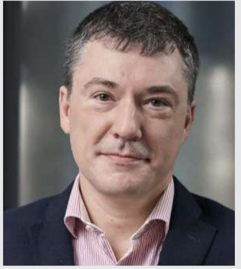
மட்டுமே ransomware தாக்குதலை சீர்குலைக்க முடிந்தது, தாக்குபவர்கள் தங்கள் தரவை என்கிரிப்ட் செய்வதற்கு முன் - 2022 இல் 34% ஆக குறைந்தது

இது கடந்த மூன்று ஆண்டுகளில் மிக உயர்ந்த குறியாக்க விகிதமாகும் மற்றும் கடந்த ஆண்டு தங்கள் தரவு encrypt செய்யப்பட்டதாக அறிக்கை செய்த 61% சுகாதார நிறுவனங்களில் இருந்து குறிப்பிடத்தக்க அதிகரிப்பு ஆகும். மேலும், 24% சுகாதார அமைப்புகளால்