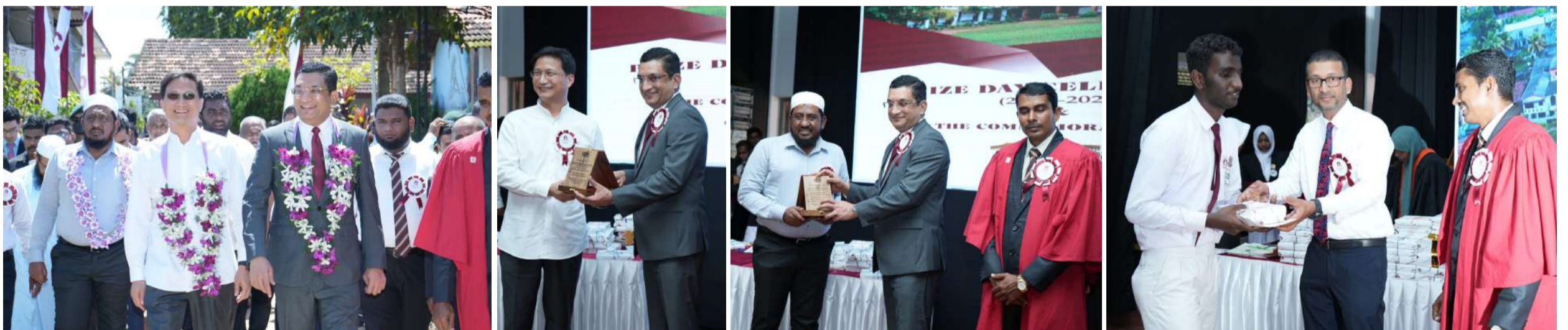
களுத்துறை முஸ்லிம் மத்திய கல்லூரியின் 105வது ஆண்டு நிறைவு விழா கடந்த வியாழனன்று (09) பாடசாலையில் இடம்பெற்றது. நிகழ்வுக்கு பிரதம அதிதியாக வெளிவிவகார அமைச்சர் ஜனாதிபதி சட்டத்தரணி எம்.யு.எம். அலி சப்ரி கலந்து கொண்டதுடன், கௌரவ விருந்தினராக இலங்கைக்கான சீனத் தூதுவர் பங்கேற்றிருந்தார். 1918 ஆம் ஆண்டு ஆரம்பிக்கப்பட்ட களுத்துறை முஸ்லிம் மத்திய கல்லூரியானது நாட்டிற்காக உழைக்கின்ற பலலாயிரக்கணக்கானவர்களை உருவாக்கி களுத்துறை மாநகரில் தேசிய பாடசாலையாக விருட்சமாகி தற்போது 105வது ஆண்டு நிறைவை கொண்டாடுகின்றமை சிறப்பம்சமாகும்.