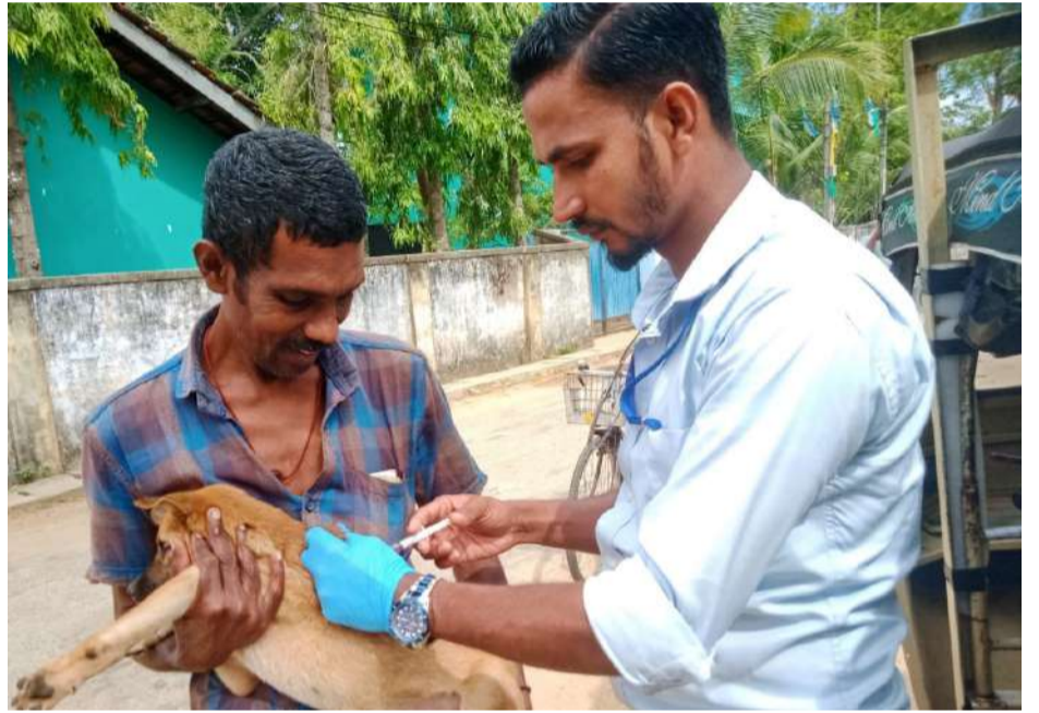
உலக நீர் வெறுப்பு நோய் தினம் செப்டம்பர் 28 ஆகும். இதனையொட்டி கல்முனை பிராந்திய சுகாதார சேவைகள் பணிமனை க்கு உட்பட்ட பல்வேறு பகுதிகளிலும் தொற்று நோய் பிரிவு மற்றும் சுகாதார வைத்திய அதிகாரி அலுவலகங்கள் இணைந்து நாய்களுக்கு தடுப்பூசி ஏற்றும் நடவடிக்கைகளில் ஈடுபட்டு வருகின்றனர். அதற்கு அமைவாக இன்று காரைதீவு சுகாதார வைத்திய அதிகாரி அலுவலகத்திற்கு உட்பட்ட பிரதேசங்களில் நாய்களுக்கு தடுப்பூசி ஏற்றப்பட்டது. (நூருல் ஹீதா உமர்)

2,340... (முன்பக்கத் தொடர்ச்சி...) அதேபோல் கடந்த வருடம் கல்வி பொது தராதர உயர்தர பரீட்சை எழுதிய மாணவர்கள் 8420 பேரும் சாதாரண தர பரீட்சை எழுதிய மாணவர்கள் 7178 பேரும் சிறைத்தண்டனை அனுபவித்தனர் என்று அந்தத் தகவல் மேலும் தெரிவிக்கிறது. மொத்த சிறைக்கைதிகளில் பாடசாலை செல்லாதவர்களே அதிகம் என்று மேலும் கூறுகிறது அந்தத் தகவல்.