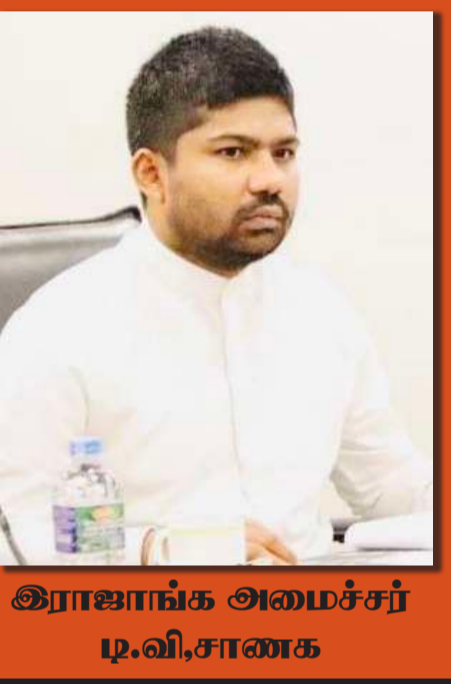
இராஜாங்க அமைச்சர் டி.வி.சாணக