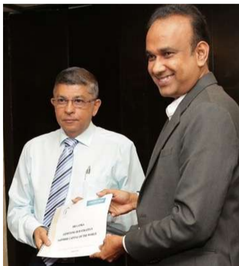
அர்ப்பணிப்புடன் செயற்படும் ஜனாதிபதி ரணில் விசும்பசிங்கவின் தொலைநோக்குப் பார்வையுடன் எமது அபிவிருத்திகளை இணைத்துக்கொள்வதற்கு எமக்குக் கிடைத்த தனித்துவமான பாக்கியமாகும். இலங்கையின் வளர்ச்சியில் இந்தத் துறையின் முக்கிய பங்கை அங்கீகரித்து ஜனாதிபதி அண்மையில் கருத்து