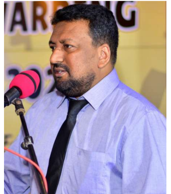
அரசியலில் மாற்றத்தை கொண்டு வர முடியும் என ஒரு சிறிய உரையையும் வழங்கினார்.