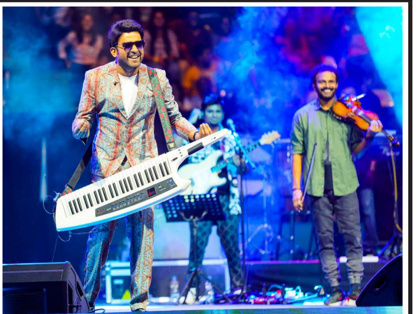
Coca-Colaவின் அனுசரணையால் ஏற்பாடு செய்யப்பட்டிருந்த 'The Legend Hariharan - Live In Colombo' பிரமாண்டமான இசை நிகழ்ச்சி இசை ரசிகர்களின் மனதைவிட்டு நீங்காதுள்ளது. உணர்வுகளைத் தூண்டி எழுப்பும் உயசனாயசயலின் இனிமையான குரல் போலவே உலகப் புகழ்பெற்ற கீபோர்ட் கலைஞர் ஞவநிநாந் னுநயளளள, பின்னணிப் பாடகியும் நடிகையுமான Sivaangி, புகழ்பெற்ற பாடகி ஞசனளளள மற்றும் தென்னிந்திய பிரபல தொலைக்காட்சி தொகுப்பாளரான ஆய Ka Pa Anand ஆகியோர் அடங்கிய தனித்துவமான நிகழ்ச்சி நாடு முழுவதிலுமுள்ள ஆயிரக்கணக்கான ரசிகர்களை கவர்ந்திருந்துள்ளது.