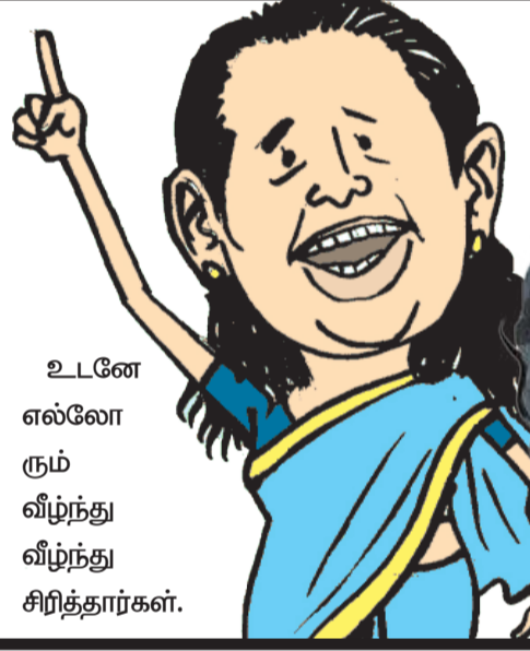
உடனே எல்லோரும் வீழ்ந்து வீழ்ந்து சிரித்தார்கள்.