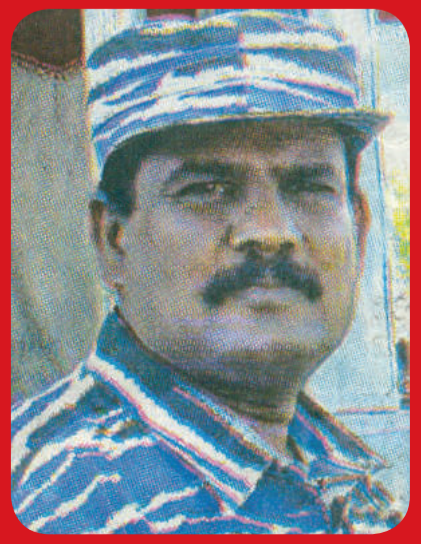
தார்சனின் ஸ கண்களில்... முந்துகிறது இவரது துப்பாக்கி. அவ்வளவுதான்..சரிகிறான் அந்தப் புலி.