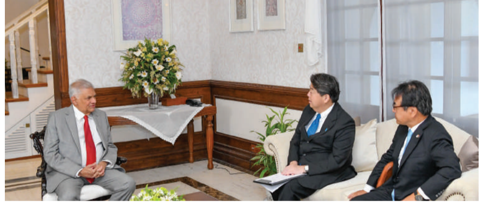
அமைதியான மற்றும் நிலையான பிராந்தியமாக பேணுவதற்கு ஒன்றிணைந்து செயற்பட வேண்டியதன் அவசியம் வலியுறுத்தப்பட்டதுடன், பிராந்திய மற்றும்

~ ஜப்பான்-இலங்கை ஒத்துழைப்பை வளர்ப்பதற்கு இரு தரப்பின் அர்ப்பணிப்பும் வலியுறுத்தப்பட்டது ~ இலங்கையின் கடன் மறுசீரமைப்பு செயல்முறைக்கு ஜப்பான் வழங்கும் ஆதரவுக்கு ஜனாதிபதி பாராட்டு ~ இலகு ரயில் திட்டம் உட்பட பல்வேறு அபிவிருத்தி திட்டங்களை விரைவுபடுத்த அவதானம் இரண்டு நாள் உத்தியோகபூர்வ விஜயத்தை மேற்கொண்டு இலங்கை வந்துள்ள ஜப்பான் வெளிவிவகார அமைச்சர் ஹயாஷி யோஷிமாசா (HAYASHI Yoshimasa) இன்று (29) கொழும்பில் ஜனாதிபதி ரணில் விக்கிரமசிங்கவை சந்தித்து கலந்துரையாடினார். ஜப்பானுக்கும் இலங்கைக்கும் இடையிலான நீண்டகால இருதரப்பு உறவுகளை நினைவு கூர்ந்து இந்தக் கலந்துரையாடல் ஆரம்பிக்கப்பட்டதுடன், பல்வேறு துறைகளில் அந்த உறவுகளை மேலும் வலுப்படுத்துவதற்கு இரு தரப்பும் பரஸ்பர புரிந்துணர்வுடன் செயற்படுவதன் அவசியமும் வலியுறுத்தப்பட்டது. இலங்கையில் கடன் மறுசீரமைப்பு செயற்பாட்டிற்கு ஜப்பான் அரசாங்கம் வழங்கும் ஆதரவிற்கு இதன்போது நன்றி தெரிவித்த ஜனாதிபதி ரணில் விக்கிரமசிங்க, கடன் மறுசீரமைப்பு தொடர்பான பொதுவான தளத்தை மேம்படுத்தும் மற்றும் செயல்முறையை விரைவுபடுத்தும் நோக்கில் பிரான்ஸ் ஜனாதிபதி இமானுவேல் மக்ரோனுடன் நடைபெற்ற கலந்துரையாடல் குறித்தும் விளக்கினார். மேலும், ஜப்பான்-இலங்கை ஒத்துழைப்பின் முக்கிய விடயமான இலகு ரயில் திட்டம் (டுசூவு), துறைமுக கிழக்கு முனையம், கண்டி அபிவிருத்தித் திட்டம், மத்திய அதிவேக நெடுஞ்சாலை மற்றும் பண்டாரநாயக்க சர்வதேச விமான நிலைய விரிவாக்கத் திட்டங்களை துரிதப்படுத்துவதன் முக்கியத்துவம் குறித்தும் இங்கு கலந்துரையாடப்பட்டது. இந்து சமுத்திர பிராந்தியத்தை