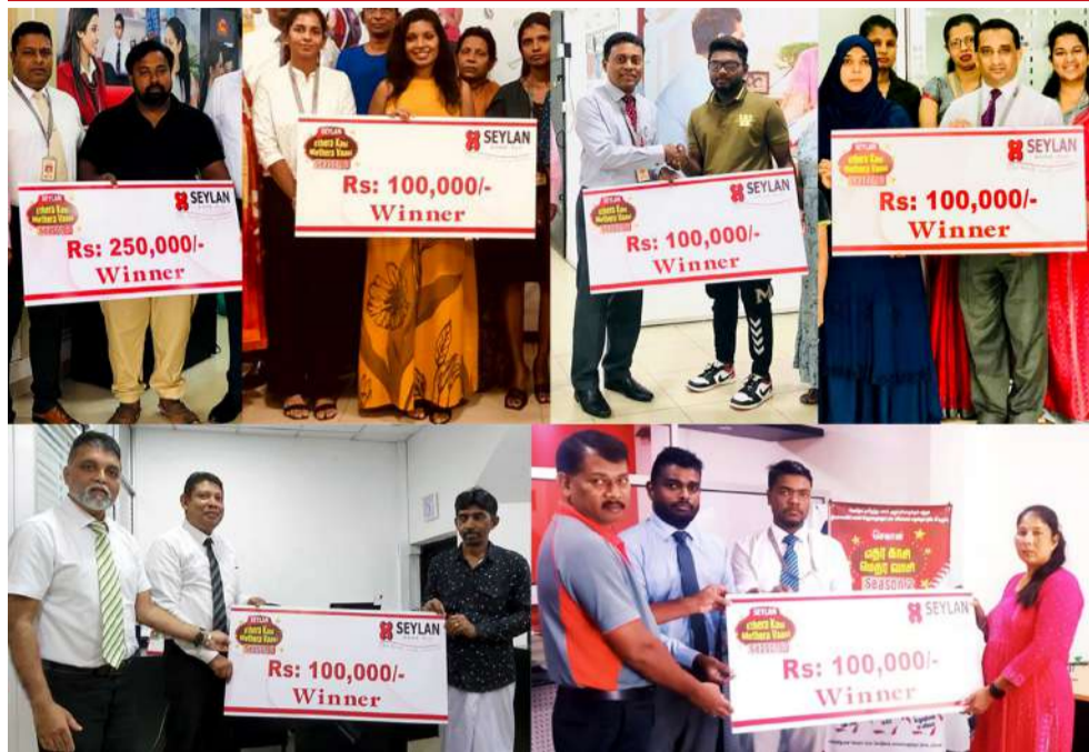
செலான் வங்கி, தனது சுவாரஸ்யமான “எதிர காசி மெதிர வாசி, சீசன் 02” குலுக்கலின் முதற்கட்ட வெற்றியாளர்களை