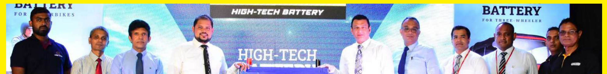
அத்துடன், பேட்டரிகள் வெகு விரைவில் மோட்டார் காரர்களுக்கும் கிடைக்கவுள்ளன. Riyelta உயர் தொழில்நுட்ப பேட்டரிகள், நீண்ட கால உத்தரவாதத்துடன், சிங்கர் ஸ்ரீலங்காவின் ஆதரவுடன், உள்ளாட்சி பேட்டரி துறையில் சிறந்த மாற்றத்தை ஏற்படுத்துவதை நோக்கமாகக் கொண்டுள்ளது. Riyelta உயர் தொழில்நுட்ப பேட்டரிகள் ஒரு தலைசிறந்த பயன்பாட்டுத் தன்மை ஏனையவற்றிலிருந்து தனித்துவமாக வேறுபடுத்திக் கொள்கின்றன: அதிநவீன SilverCell தொழில்நுட்பத்தின் ஒருங்கிணைப்பு, ஜேம்மனிய விஞ்ஞானிகளின் முன்னோடி தயாரிப்பாக உள்ளன.

நீடித்து உழைக்கும் நுகர்வோர் சாதனங்களின் சில்லறை விற்பனையில், நாட்டில் முன்னணி வகித்து வருகின்ற சிங்கர் ஸ்ரீலங்கா பிஎல்சி, இலங்கையில் Riyelta பேட்டரிகளுக்கான உத்தியோகபூர்வ