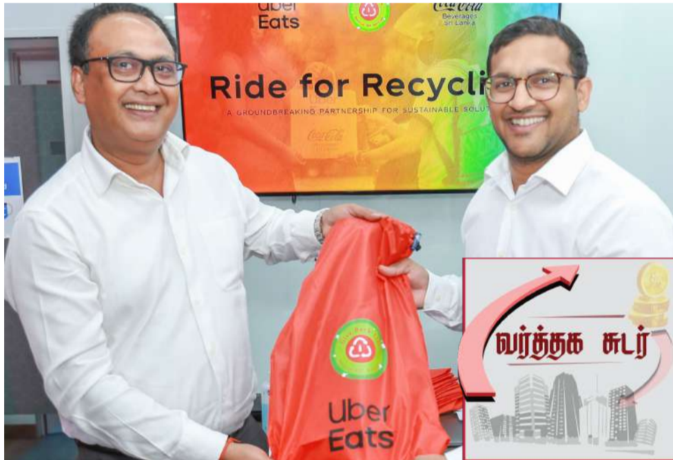
உணவகங்களில் இருந்து நேரடியாக PET போத்தல் சேகரிப்புத் திட்டத்தை ஆரம்பிக்க முடியும். அதற்காக பொதி விநியோகச் சேவை பங்குதாரர்களின் ஒரு

மேல் மாணாக்கத்தில் உள்ள Uber Eats சேவை வலையமைப்பைப் பயன்படுத்தி கொழும்பில் உள்ள வீடுகள் மற்றும்