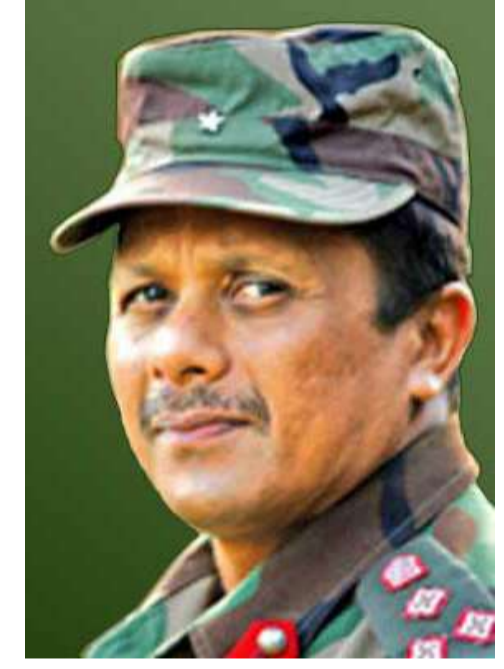
பிரிகேடியர் பிரசன்ன சில்வா